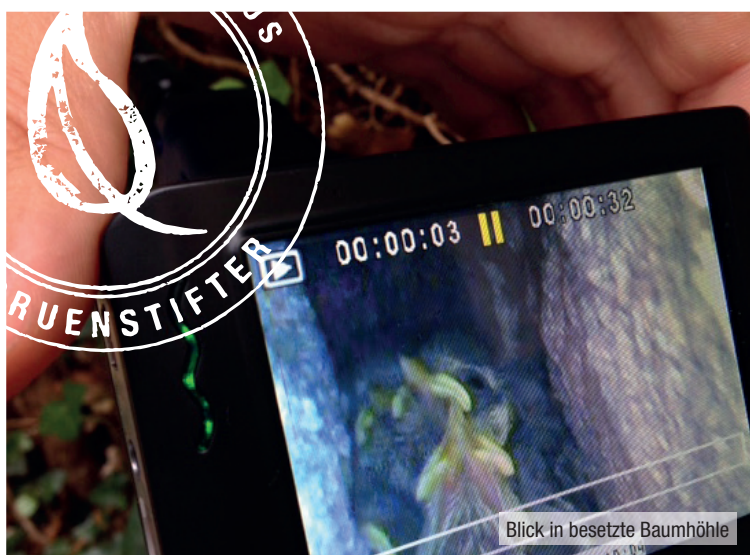
Blick in besetzte Baumhöhle

Fragen Sie bei uns an, wir beraten Sie gerne. Ein Gutachten schafft Klarheit bei allen Beteiligten und gibt klare Handlungsrahmen vor.